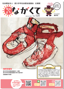
「福祉のまちながくて」